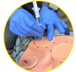
Entlastungspunkt nach Monaldi