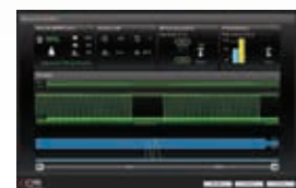
202-56050 RA Wireless SR Software 3 Lizenzen

Touchpad, über das man ein objektives Echtzeit-Feedback für die CPR-Leistung erhält. Eingabe manueller Events möglich. Datenübertragung und -speicherung auf PC mit detaillierter Auswertung für anschließendes Debriefing. Steuerung und Auswertung von bis zu sechs Modellen gleichzeitig möglich.