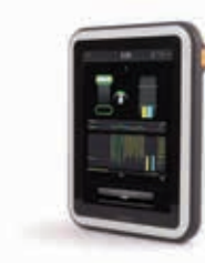
202-30033 SimPad SkillReporter

Objektives Echtzeit-Feedback über Kompressionstiefe, -frequenz, Handentlastung und -position sowie zur Beatmung. Prozentuale Gesamtauswertung der CPR direkt nach dem CPR-Training möglich.