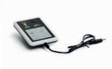
170-30050 Skill Guide

Objektives Echtzeit-Feedback über Kompressionstiefe, -frequenz, Handentlastung und -position sowie zur Beatmung. Prozentuale Gesamtauswertung der CPR direkt nach dem CPR-Training möglich.